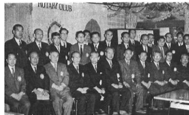
【昭和34年3月12日(土):創立】