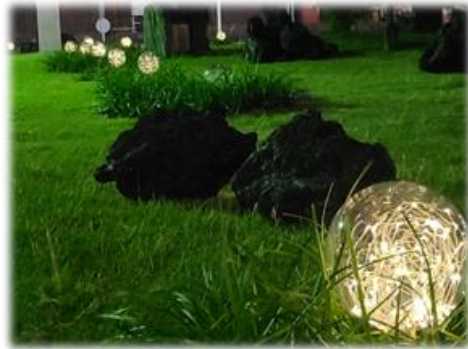
(製油所内での「土壌発電」実証の様子)

最後に、麻里布製油所では、これからも「地元への貢献」や「地域の皆様との共生」を大切にしていきたいと考えています。引き続き、ご指導、ご鞭撻をよろしく願います。