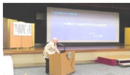
【日刊いわくに 2023. 8. 18 掲載】