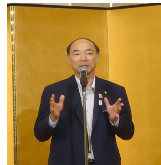
【上田ガバナーノミニ挨拶】