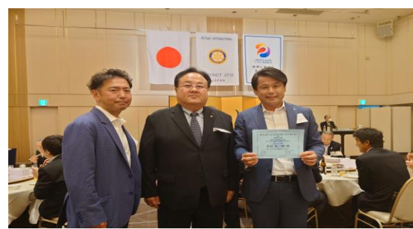
【3回の研修を終え無事卒業証書を頂きました！】