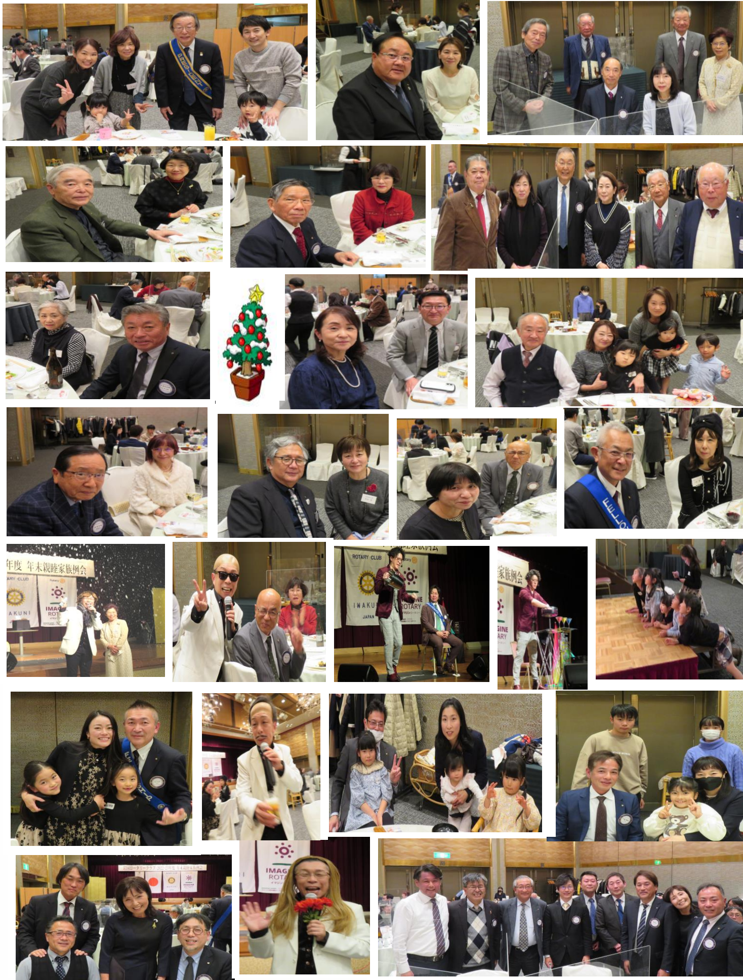
4. みんなのためになるかどうか