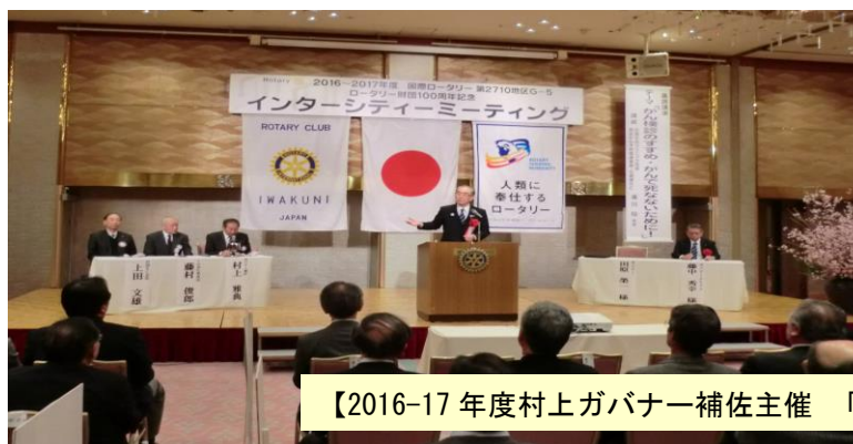
【2016-17年度村上ガバナー補佐主催 「IM」本会議・懇親会の様子】