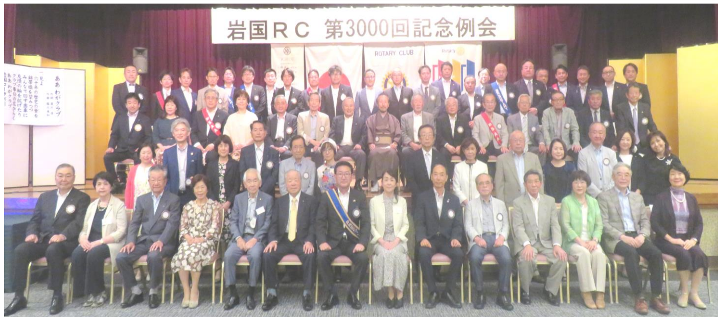
岩国RC 第3000回記念例会