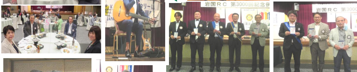
【ニコニコボックス最多金額賞】・【ニコニコボックス最多回数賞】