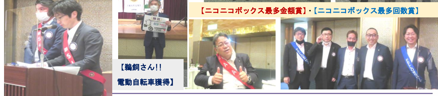
【輪銅さん!! 電動自転車獲得】